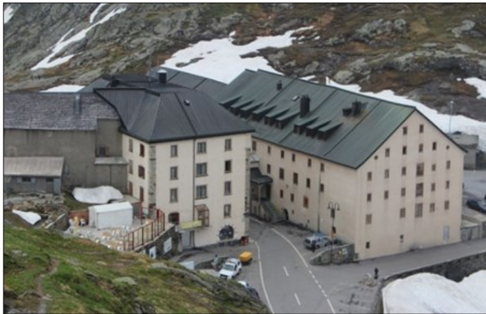
L'hospice bien connu du Grand-Saint-Bernard

Vendredi 6 septembre, 19h30, Maison de paroisse de Nods, entrée libre, collecte.