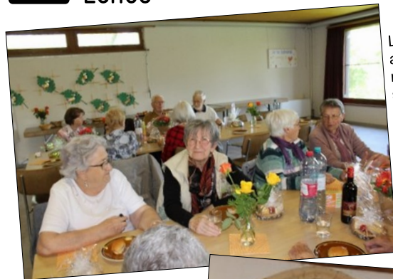
Loto pour les aînés, le 17 mai, avec des sourires et de beaux prix pour chacune et chacun puisqu'il n'y avait que des gagnants.