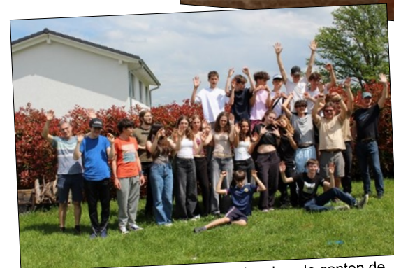
Camp de catéchisme à Epanades dans le canton de Fribourg pour les jeunes de 10 et 11H sur le thème de l'estime de soi.