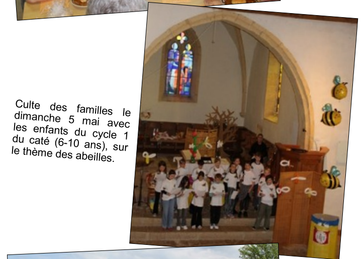
Culte des familles le dimanche 5 mai avec les enfants du cycle 1 du caté (6-10 ans), sur le thème des abeilles.