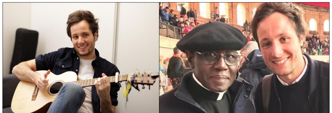
Vianney, de son vrai nom Vianney Bureau , est né le 13 février 1991 à Pau.

l'étaient, mais la religion est une étiquette. Cela compte moins pour moi que l'intuition du Ciel et d'une mission qu'il nous donne: celle de l'amour. Apprendre à le donner, le recevoir, le transformer. En faire une force.» Le chanteur Vianney dit retrouver une forme de spiritualité dans la musique, «un mystère» qui le dépasse et qui le transcende. / sr