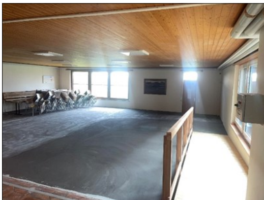
La Maison de paroisse pendant les travaux

L'inauguration se déroulera le dimanche 8 décembre, à 12h00 , après le culte et l'assemblée qui suivra.