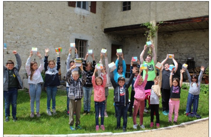
Les enfants avec leur tirelire confectionnée, dans les mains