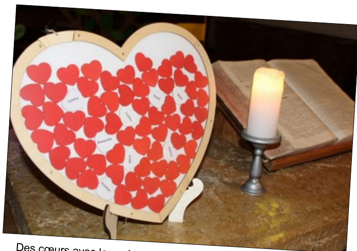
Des cœurs avec les prénoms des jeunes confirmands et d'autres déposés par leurs proches présents lors de la cérémonie.