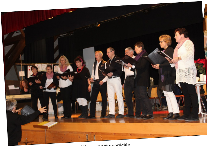
L'Arzillière a été vivement appréciée.

Le bénéfice de cet événement, ainsi que l'offrande sont destinés à un projet que notre paroisse soutient et qui vise à venir en aide à des familles démunies en Transcarpatie (ouest de l'Ukraine). /uk