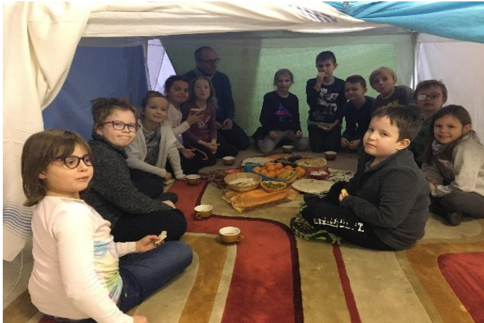
Repas sous la tente comme Sara et Abraham

Dimanche 6 mai, à 10h00, à l'église de Diesse, avec la participation de la fanfare «L'Espérance» de Lamboing? Les enfants de 3 à 6H vous invitent à un culte plein de vie sur le thème «Et si Dieu me bénissait, qu'est-ce que ça changerait?».