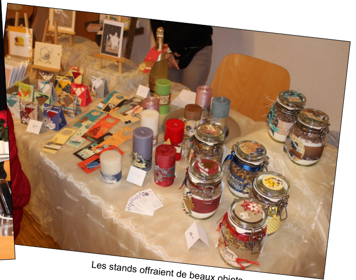
Les stands offraient de beaux objets