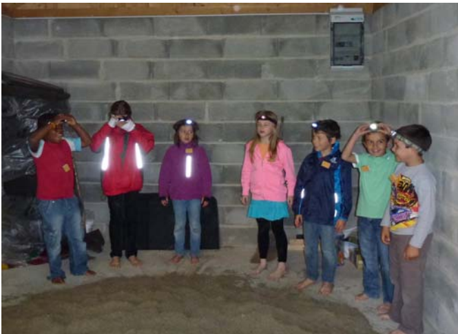
Pieds nus, avec une lampe frontale, les jeunes participants s'apprêtent à chercher des objets dans le tas de sable qui avait été préparé dans le garage.

La Maison de paroisse de Diesse a vu se rassembler plus de 120 enfants le samedi 9 juin. Manifestation organisée tous les deux ans, la Fête des enfants avait pour thème "Les p'tits curieux sur un Plateau". De nombreux ateliers étaient organisés: Chercher des objets dans du sable, découvrir des contes magiques, apprendre à faire une souris en sculpture de ballons. A voir les sourires et les rires, l'enthousiasme et le plaisir étaient au rendez-vous. La journée s'est terminée par une célébration au cours de laquelle l'histoire d'un homme curieux a été contée, celle de Zachée. Les enfants sont repartis heureux avec la marionnette qu'ils ont confectionnée à la main.