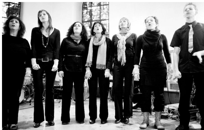
Le chœur Asparagus

Dimanche 3 juin, à 10h00, à l'église de Diesse