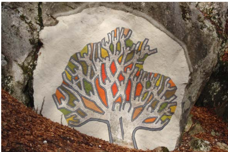
L'Arbre de Vie, fresque à découvrir au sentier des Sculptures à Lamboing

L'Arbre de Vie selon la Cabale, par Z'ev ben Shimon Halevi